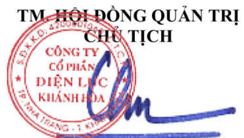
Nguyễn Cao Ký